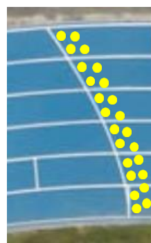
Ill. 1: Développante 24 part., 6 couloirs