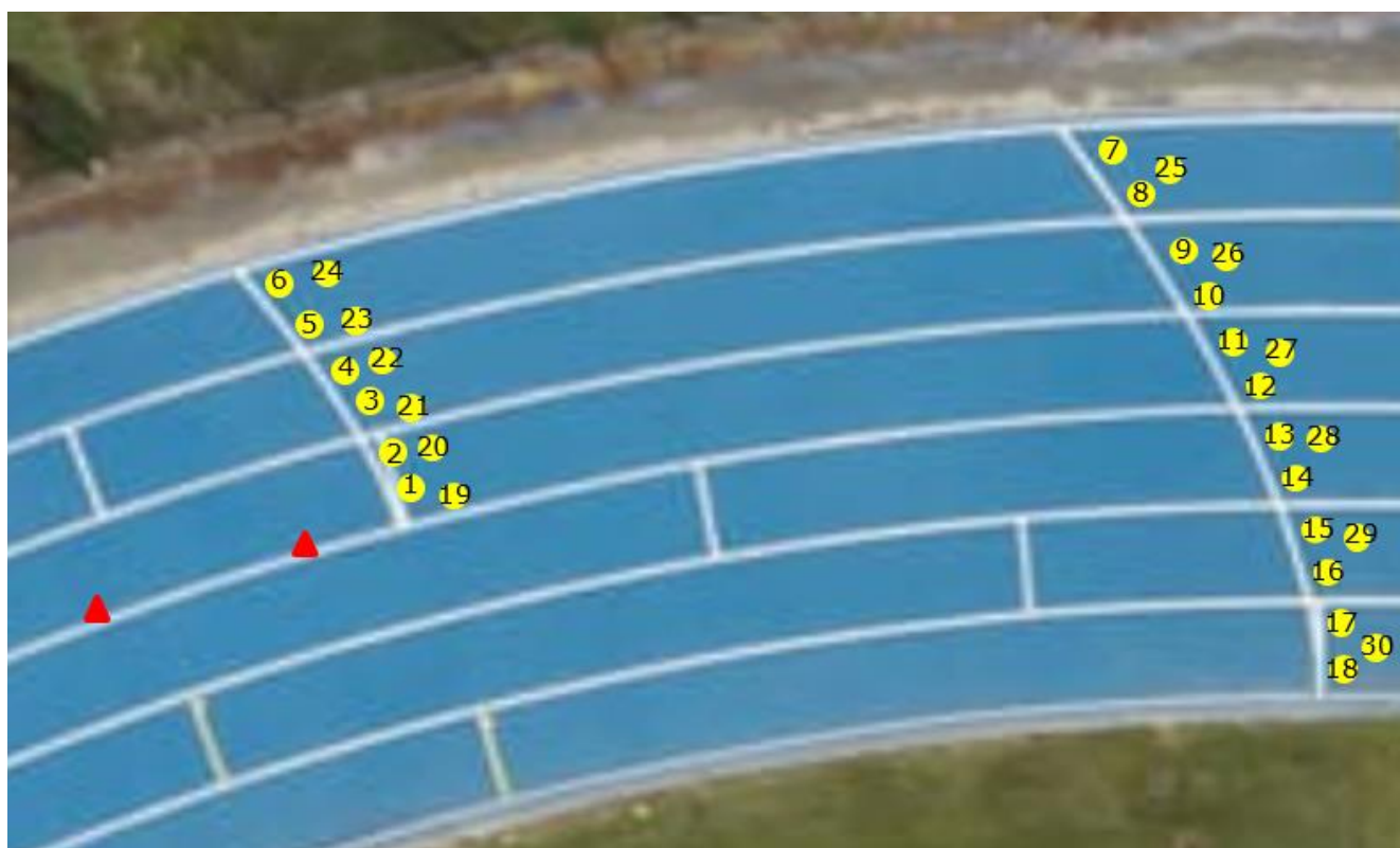
Ill. 4: Disposition au départ Finale CH avec 6 couloirs