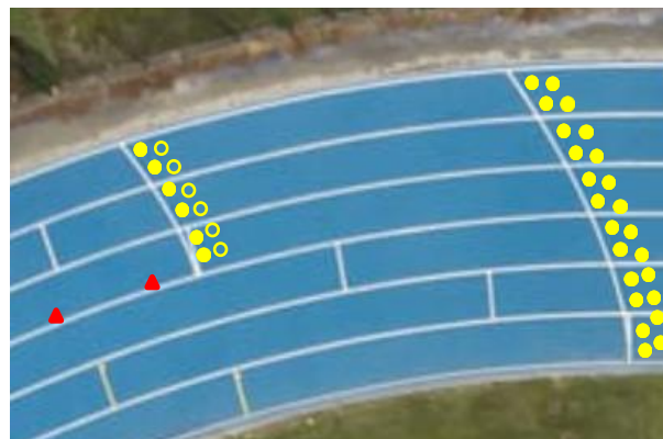
Ill. 3: départ Oslo 30/36 part.